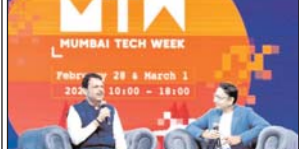
मलाट के उपमुख्यमंत्री देवत ऊपगवलीस ने मुंबई में मुंबई टेक वीक 2025 के दौरान मिश्रण का लोकार्पण, एकाई और साहजिकवर्तियों शीर्ष विधिय पर भावतरीत है।