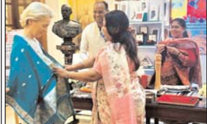
राष्ट्रीय आजादी की अथक्ष उद्घाटन वीन ट्रे लेनेन नई दिल्ली में भारत के राष्ट्रीय अमृतम तंत्र के उद्घाटन के तथक्ष मंत्र लेतार शाहमिल लती हुई।