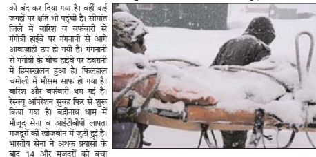
संतर भेजने के लिए एयरलिफ्ट करने हैं। उन्होंने कहा कि मैं खुद भी स्थलीय निरीक्षण करने को चमोली के लिए

देहरादून, 01 मार्च (एजेंसी)। उत्तराखण्ड के पर्वतीय इलाकों में लगातार हो रही बर्फानी के कारण कर्नाट वैसी स्थिति हो गई है। बर्फानी के चलते कई मार्ग बंद हो गए हैं। सड़कों पर कई किमी तक बर्फ ही बर्फ पसरि हुई है। जिससे जन-जीवन अस्त-व्यस्त हो गया है। आज भी उत्तराखण्ड के कई जिलों में बरफिर के आसार हैं। इसके बाद तीन और चार मार्ग को भी मौसम खराब होने की संभावना है। रजिनाथ को देहरादून, उत्तरकाशी, रुद्रगंगा, टिहरी, पौड़ी, चमोली, पिथौरागढ़, बागेश्वर, अल्मोड़ा, नैनीताल और चंपावत में बरफिर की संभावना है। 2500 मीटर व उससे अधिक ऊंचाई वाले स्थानों में हल्को से मध्यम बर्फानी हो सकती है। हिमखलन को लेकर भी अलर्ट जारी किया है। उत्तराखण्ड के उत्तरकाशी, चमोली, रुद्रगंगा, पिथौरागढ़ और बागेश्वर हिमखलन को लेकर चेतावनी जारी की गई है। इसमें सबसे ज्यादा खतरा चमोली जिले को है। उत्तराखण्ड के माणा में तेलीशार टुटने से भारी हिमखलन हो गया था। जिससे बीआरओ के कैमरे को क्षति पहुंची है। बताया गया था कि बर्फ बचाए गए कर्मियों को चिकित्सा सहायता और आगे के इलाज के लिए