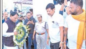
मलाट प्रदेश के मुख्यमंत्री मोहन यादव और केन्द्रीत गृह मंत्री अमित शाह विचारक में मलाट नए नाराजी टेकमुक्त को इस्वीं पुराय विधिय पर भावतरीत रमया में शामिल हुए।