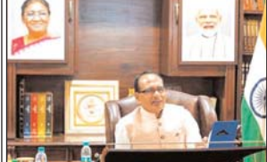
विधानर सिंध प्योतन ने नई दिल्ली में रमया कृष्ण वीन ट्रे लेनेन नई दिल्ली में वींटीयो कॉन्फेरेणस के मायतने से लामाहिक रमया टेकव को अथक्षता की।