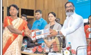
जरावल के मुख्यमंत्री देवत तोरेन और शिवा मंत्री राजनय तोरेन तस्वी में परिवारेजय जनम में एक कार्यक्रम के दौरान लम्हावर्तियों को लम्हावर्तियों और उपहार वितरित करते हुए।