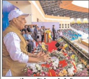
शा मंत्री राजनय रिंके हेददावत में राष्ट्रीय विधान दिवस समारोह में शामिल हुए।