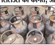
नई दिल्ली, 01 अप्रैल (एजेंसी)। तेल कंपनियों ने 19 फिलो कमर्शियल सिलेंडर और पांच फिलो एफटीएल (अडे टैंक एप्लीकेशन) सिलेंडर की कीमतें कम कर दी हैं। सूची में बताया कि 19 फिलो कमर्शियल सिलेंडर की कीमत अब 30.50 रुपये कम की गई है। दिल्ली में एक अग्रलेख से इसकी कीमत 1764.50 होनी। पांच फिलो एफटीएल की कीमत अब 7.50 रुपये कम हो गई है। एक मांस को तेल कंपनियों ने एलएजी सिलेंडरों की कीमतों में बढ़ोतरी की घोषणा की थी। 19 फिलो कमर्शियल सिलेंडर की कीमतें 25 रुपये बढ़ दी गई थीं, जिसके बाद इसका दाम बढ़कर 1795 प्रति सिलेंडर हो गया था। एक फायरी को डीएन गैस सिलेंडर की कीमतें मुंबई शहर, दिल्ली, कोरबा, मुंबई और चेन्नई में अलग-अलग थीं। एक मांस के बाद से सभी मुंबई शहरों में डीएन गैस सिलेंडर की कीमतों में वृद्धि देखी गई। मांस में सस्कराते से पहले स्तर पर उपायविहीन कच्चे तेल पर अद्ययावत लाभ कर को 3,300 रुपये प्रति टन से बढ़ाकर 4,600 रुपये प्रति टन कर दिया था। यह कर विभागीय अतिरिक्त उत्पन्न शुल्क (एसटीडी) के रूप में लगाया गया है। अतिरिक्त के शुल्क, फेरुल कच्चे तेल पर अद्ययावत लाभ कर बढ़ाया गया था, लेकिन