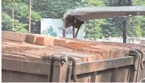
विभाग ने इस पर सख्त कार्रवाई की।

कोरबा। यह सौंपकर विधानसभा चुनाव में पूरा प्रशासन और पुलिस का अमला डटा हुआ है, ऐसे में हर तरह के अयोग्य काम आयोजी से किये जा सकते हैं, अगला पड़ा सकता है। माइनिंग विभाग ने इसी श्रृंखला में सख्ती बरतते हुए ईट से भरें ट्रैक्टर को पकड़ लिया। उसे मानिकपुर पुलिस के सौंप दिया गया। अगली कार्रवाई माइनिंग विभाग को करना है।