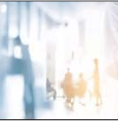
पटना, 01 नवंबर (एजेंसी)। प्रदेश में किसी भी श्रेणी के अस्पताल, नर्सिंग होम के साथ किम्यूरी या मेडिनिटी अस्पताल के संचालन के लिए निम्नलिखित अधिनियम रूप से करण होगा। बिना निम्नलिखित अस्पताल चलाना संभव नहीं हो पाएगा। संबंधित अस्पताल को निम्नलिखित के साथ ही न्यूनतम मानकों का भी पालन करना होगा। सरकार ने इस कार्य को प्राथमिकता के आधार पर करने के लिए विभागीय लेटराईनमेंट प्रवर्तन कार्यों को क्रियान्वित करने के लिए राज्य परिषद पर जिसला रजिस्ट्रेशन प्रक्रिया का पुनर्निर्माण कर दिया है। जिसको अधिसूचना स्वास्थ्य विभाग ने सफलता के साथ कर दे निम्नलिखित के अन्तर्गत के न्यूनतम मानकों का अद्ययावत

स्वास्थ्य सचिव करण, जबकि इस परिषद में सदस्य सहित सभी निदेशक प्रमुख प्रशासन। सदस्यों में सदस्य के रूप में बिहार कार्डिसिल ओईफ्फिस रजिस्ट्रेशन के अध्यक्ष, डैटन कार्डिसिल के प्रतिनिधि, निदेशक निदेशक निदेशक, निम्नलिखित परिक्षण के निदेशक, फूड परिक्षण के अध्यक्ष, आर्युवेदिक, सिद्धि एवं न्यूनतम परिक्षण के प्रतिनिधि, आद्यरक्षण के अध्यक्ष, एपामेडिकल से संबंधित प्रतिनिधि, प्रशिक्षण रैडक्राफ्ट सोसाइटी के प्रतिनिधि, मेडिकल कलेज के प्रतिनिधि रोगी/लोकिक जिवात स्तर पर गठित रजिस्ट्रेशन प्राधिकरण में जिला/किसी को अध्यक्ष पर का जिम्मा सौंपा गया है। संबंधित स्विकार करने होंगे। विकास अनुभू और जिला आद्यरक्षण के अध्यक्ष को शास्त्रिक जिला का अध्यक्ष होगा। विभाग के अनुप्रार किसी भी अस्पताल को निम्नलिखित के लिए न्यूनतम मानकों का पालन करना होगा। निम्नलिखित कार्याचार्यों की अनुमति आवेदन किया जाएगा। जिसमें भी मेडिकल रिकार्ड हैं उनका व्यवस्थापन करना होगा रिपोर्ड उपलब्ध कराने की व्यवस्था करनी होगी। रजिस्ट्रेशन के लिए अस्पताल को निर्धारित फीस के साथ आवेदन या अपलोडेशन आवेदन देना होगा।