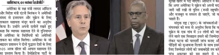
वाशिंगटन, 01 नवंबर (एजेंसी)। अमेरिका के रक्षा मंत्री लॉयड ऑस्टिन और विदेश मंत्री एंटीनी ब्लिंकन ने अमेरिकी संसद से इजरायल और यूकेन के लिए तत्काल सहायता मंजूर करने का अनुरोध किया है। उन्होंने अपनी दलोंने खतों द्वारा कहा कि व्यापक सहायता देने से दुनियाभर में अमेरिका के विरोधियों को अमेरिकी ताकत का संदेश मिलेगा। अमेरिका के जो बाइडेन प्रशासन ने दोनो दूरदर्शन से लिए 30.5 अरब डॉलर की आपदा राहतदान देने का प्रस्ताव किया है। डेमोक्रेटिक पार्टी के सदस्य वाले ऊपर सदन कीट में प्रस्ताव को समर्थन मिलने में कोई दिक्कत नहीं है, लेकिन रिपब्लिकन पार्टी के बहुमत वाले निम्नले सदन हाउस ऑफ रिप्रेजेंटेटिव में प्रस्ताव को समर्थन मिलने में संभयता है। एप स्पोक

मार्क जानसन ने रिस्क इजरायल पर फोकस करने और इस्लाम के लिए अतिरिक्त सहायता देने के लिए धन में कटौती करने का प्रस्ताव किया है। अमेरिकी संसद में इस मुद्दे पर मतभेद रहाने पर ब्लिंकन और ऑस्टिन ने चेतावनी दी कि कतरे के साथ युद्ध में यूकेन और जापान के विपक्ष में इजरायल को मदद से विकल्प रहने के भयावक परिणाम होंगे। अमेरिका को निष्क्रियता अमेरिका और बच्ची दुनिया की