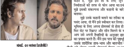
मुंबई, 01 नवंबर (एजेंसी)। किसी भी शौ या प्रोजेक्टर का हिस्सा बनने को लेकर कलाकारों के अग्रण करते हैं। कभी यह कराने से प्रभावित होते हैं, कभी अभिनय, कभी सहकलाकार, तो कभी उससे मिलने वाली फीस उनके लिए यह करने का कारण बनती होसकती है। एक्टर, असली और नाम तो सुना होगा भाग्यलाल के अभिनय आभिर उरुवी किंगडम भाग्यलाल भाग्यलाल था कि कई श्रवों के टुकड़े-टुकड़े हो गए और सभी मुश्किलों को पार करने में लागण एक साता लाल गया था।