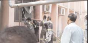
कौशांबी, 02 सितम्बर [एजेण्टी]

जिला अस्पताल के सिटी स्कैन वार्ड के पैन्ल रूम में शनिवार को सुबह करीब 10 बजे अपमानक भाई स्वर्ण के चक्करों आग लग गई। इससे चार्ज के अंतराल जिला अस्पताल में आग मरीजों और तीमारदारों में भगदड़ मच गई। सूचना पर पहुंचे फायर ब्रिगेड