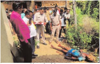
घटना स्थल का जांचवा लेती जट्टा पुलिस को टीम

कोरबा। शनिवार को सुबह गांव पुठना में हुई घटना में पुत्र ने अपने पिता को फरसा से हमला कर हत्या कर दी। घटना को अंजाम देने के बाद वह गांव से भाग कर कटघोरा पहुंचा और पुलिस के सामने सरेंडर कर दिया।