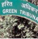
राष्ट्रीय हरित अधिकरण