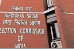
विशिया, 02 नवंबर (एजेन्सी)।

चुनाव आयोग इस बार चुनाव को पारदर्शित एवं पारदर्शिता के लिए काका गैरिफर है। इसी का परिणाम है कि पहली बार चुनाव में लगे ऑनलाइन-कमिश्नरियों को यह बताया होगा कि उनका कोई रिश्तेदार तो चुनाव नहीं लड़ रहा। इसके अलावा उन्हें आपाधिक प्रकरणों की भी जानकारी देना होगा।