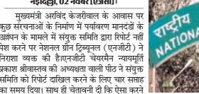
नई दिल्ली, 02 नवंबर (एजेन्सी)।