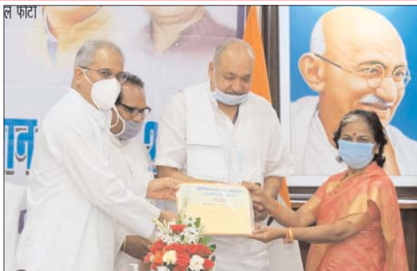
मुख्यमंत्री श्री भूपेश बघेल ने छत्तीसगढ़ में शिक्षक पात्रता परीक्षा प्रमाण पर की वार्ता की 7 वर्ष की अधिक की विलोपित करते हुए, इस अवसर पर किया है। स्कूल शिक्षा विभाग में शिक्षकनिर्माण को प्रेरणा शिक्षक और शिक्षक के रूप में संचालित किया गया। प्रश्न में अपने घोषणा पत्र के अनुसार दो वर्ष की सेवा पूर्ण करने वाले 35 हजार से अधिक शिक्षक संवर्ग (पंचवारत एवं सररीय निकरय) का भी शिक्षा विभाग ने संचालितयन कर दिया है।

शिक्षकों को प्रोत्साहित करने एवं उनके कार्यभारों को प्रभाणित करने के उद्देश्य से शिक्षकों को प्रत्यक्षत पूरकपुर एवं मुख्यमंत्री गौरव असेसमेंटन प्रकल्प प्रदान किया जाता है। शिक्षक दिवस के अवसर पर राज्य स्तरीय शिक्षक सम्मान समारोह में प्रदेश के 4 महान सार्थक शिक्षक विभूतियों के नाम से चार शिक्षकों को 'पद्मसलत पुरस्कार' बखरी