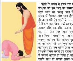
पूछे लगता है अभी भी हमारे दिलों में शिक्षकों के लिए विशेष स्थान है।