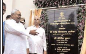
बिहार के तस्वीर राउट विपणन अंतर्गत, बिहार के मुख्यमंत्री नीतीश कुमार, पटना में पटना विश्वविद्यालय के पूर्वनिर्वाहक लैबरेटरी लैबरेट हाउस के उद्घाटन के दौरान।