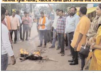
भाजपा युवा मोर्चा, महिला मोर्चा द्वारा उदयनिधि स्टालिन का दहन किया गया पुतला दहन

कोरिया/बैकुलपुर। कोरिया जिला मुख्यालय बैकुलपुर स्थित भाजपा कार्यालय से जिला भाजपा के पदाधिकारी युवा मोर्चा के पदाधिकारी कार्यालयों और भाजपा महिला मोर्चा के पदाधिकारियों द्वारा 5 सितंबर को विरोध प्रदर्शन करते हुए नगर पालिका कार्यालय के सामने तमिलनाडु के मंत्री उदयनिधि स्टालिन का पुतला दहन किया गया था। इस टिप्पणी पर पूरे देश में सनातन धर्म पर हुए इस उन्मादी प्रवृत्ति को विरोध करने वाले लोगों ने इस टिप्पणी के विरोध में सनातन धर्म को समाजिक न्याय और समता का विरोधी कहे हुए जाति धर्म पर चोटें लगाता बताया था जिसके बाद स्टालिन के पुतले को जलाने में सुरुजवा जिले के पदाधिकारियों ने सहयोग प्रदान किया था।