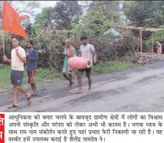
अपनी संस्कृति अपना विश्वास