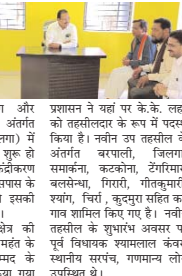
कोरबा। अनु विभाग और विकासखंड कोरबा के अंतर्गत आने वाले बरपाली (जिला) में उप तहसील को सुविधा युक्त हो गई है। प्रशासनिक विकेंद्रीकरण के अंतर्गत सरकार ने आरंभिक के कई गांव के लोगों को इसकी सुविधा उपलब्ध कराई है।