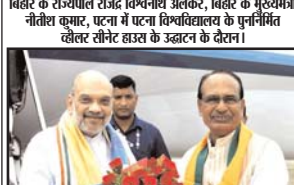
केंद्रीय गृह मंत्री अमित शाह के जबर्पूर आमरण पर मध्य प्रदेश के मुख्यमंत्री शिवराज सिंह चौहान ने उनका स्वागत किया।