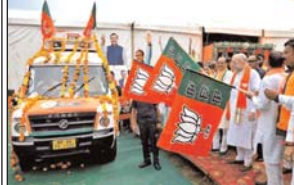
मंडला जिले में माजपा की जन आशीर्वाद यात्रा के शुभारंभ के दौरान केंद्रीय गृह मंत्री अमित शाह और अन्य लोगों के साथ मध्य प्रदेश के मुख्यमंत्री शिवराज सिंह चौहान।