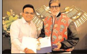
बीतीलीआई राविव जय शाह आगामी 2023 आईसीसी पुरुष क्रिकेट विश्व कप के लिए अनुभवी अभिनेता अभिताम बच्चन को मोडेलन टिकट प्रदान करते हुए।