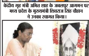
राष्ट्रपति गोपाल मुर्मू ने नरेंद्र मोदी के राष्ट्रपति बनने में पूर्व राष्ट्रपति एच. रामाकृष्णन को उनकी जयंती पर श्रद्धांजलि अर्पित की।