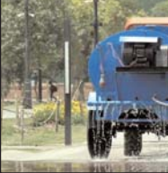
नईदिल्ली, 06 सितम्बर [एजेसी]।

दूरें शुकु नौसमा का अरस कहें है पर अरस नौनो बहं का प्रभाव... सोमवार (चार सितंबर) का दिन सितंबर में 123 साल का दूसरा समसे मर्दि दिन