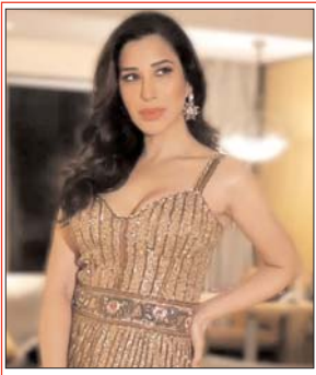
सोफी चौधरी ने बोलवनेस से इंटरनेट पर बरपाया कहर, एक्ट्रेस को हॉटनेस देख युजर्स ने दिए जबरदस्त रिप्लाइस

बॉलीवुड एक्ट्रेस और सिंगर सोफी चौधरी आज किसी भी पहचान को मोहताज नहीं हैं। उन्होंने कई गानों के लिए प्लेबैक सिंगिंग भी की है। उनका नाम बेहतरों में मॉडल को लिस्ट में भी शामिल है। एक्ट्रेस भले ही 35 साल की हो चुकी हैं, लेकिन आए दिन अपनी हॉटनेस और बोलवनेस से इंटरनेट का पारा बड़ा देती हैं। हाल ही में उनकी लेटेस्ट फोटोशूट की कुछ तस्वीरें सोशल मीडिया पर जैसी से वायरल हो रही हैं, जिसमें उनकी अदाएं देखकर फैंस मदहोश हो गए हैं। बॉलीवुड एक्ट्रेस सोफी चौधरी ने अपने करियर की शुरुआत साल 2000 में पॉप सिंगर के तौर पर की थी। अब उनका नाम फिल्मों दुनिया को जानी-मानी अभिनेत्रियों को लिस्ट में शामिल है। हाल ही में एक्ट्रेस सोफी चौधरी ने अपने लेटेस्ट फोटोशूट की तस्वीरें फैंस के बीच साझा की हैं। इन फोटोज में उनका स्टYLिंग अत्यंत देखकर फैंस एक बार फिर से बेकवूब हो गए हैं। फोटोज में आप देख सकते हैं एक्ट्रेस सोफी चौधरी ने गोल्डन कार का रिवॉल्विंग गाउन पहना हुआ है, जिसमें वो केमर के सामने एक से बहकर एक पोसा देते हुए अपना परफेक्ट फिगर प्रदर्शित करती हुई नजर आ रही हैं। बातों को ओपन कर के और साथ ही लाइट मेकअप कर के एक्ट्रेस सोफी चौधरी ने अपने आउटलुक को कैजुअल किया है। बात दें कि एक्ट्रेस सोफी चौधरी जब भी अपनी फोटोज इंस्टाग्राम पर पोस्ट करते हैं तो फैंस उनके हर एक लुक पर जबरदस्त लाइक्स और कमेंट्स करते हैं। हालांकि इन फोटोज में भी कुछ ऐसा ही देखने को मिल रहा है। एक यूजर ने कमेंट करते हुए लिखा है- 'गॉर्जियस। दूसरे यूजर ने लिखा है- 'ब्यूटीफुल। तृतीय, तीसरे यूजर ने लिखा है- 'सबाली। ऐसे ही एक के बाद कई हार्ट और फ्लायर इसीकी भेजते हुए अपने प्रतिक्रियाएं दे रहे हैं।