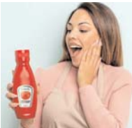
दावा करती है। टोमेटो केचप हेल्दी होते हैं? जंक फूड लेकर नॉर्मल खाना सभी का स्वाद बढ़ाने के लिए केचअप का इस्तेमाल करते हैं। आपको जानकारी के लिए बता दें कि केचअप को बनाने में कई तरह के केमिकल्स का इस्तेमाल किया जाता है, जिसके कारण यह लंबे समय तक फ्रिज में रह जाता है और यह जल्दी खराब नहीं होता है, यही कारण है कि इसे ज्यादा खाया जाएगा तो शरीर को कई

कई लोग ऐसे हैं जिन्हें केचअप खाना बहुत पसंद होता है। ऐसा नहीं है कि सिर्फ जंक फूड के साथ बल्कि यह किमी भी खाने के साथ शीतल केचअप लेना स्वस्थ ही करते हैं। समोसा, डोसा, पकोड़े किमी भी खाने के साथ केचअप खाना खूब पसंद करते हैं। वजह तो यह है कि केचअप लोगों को पहली पसंद होती है। लेकिन आपको जानकारी के लिए बता दें कि बहुत ज्यादा केचअप खाना हेल्थ के लिहाज से काफी ज्यादा नुकसानदायक होता है। क्योंकि इसमें सोडियम की मात्रा काफी अधिक होती है। यह शरीर के लिए नुकसानदायक हो सकता है। ज्यादा केचअप खाने से शरीर को होने वाले नुकसान