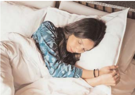
नींद आती है तो इसके लिए आपको रात में सोने से पहले ये ड्रिंक पी सकते हैं। पुदीने की चाय होलाकि हेल्थ एक्सपर्ट्स रात को चाय पीने के लिए मना करते हैं। क्योंकि इसमें कैफीन की मात्रा पर्याप्त होती है। लेकिन पुदीने की चाय कैफीन और नींद को बढ़ाती है। साथ ही इसमें मौजूद मेन्थॉल

कैमोमाइल टी रात में बेहतर नींद के लिए आप कैमोमाइल टी का ड्रिंक के तौर पर सेवन कर सकते हैं। कैमोमाइल टी सूजन को कम करने के साथ रिस्कन के लिए भी फायदेमंद साबित होता है। नींद को गुणवत्ता में सुधार करने के लिए कैमोमाइल चाय जानी जाती है। क्योंकि नींद की कमी होने पर इसका असर आपको सेंशन पर पड़ता है। इसलिए अगर आपको भी नींद