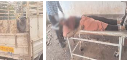
जांजगीर-चाँपा। जिला मुख्यालय के जांजगीर-चाँपा जिले में तेज रफ्तार ट्रैक्टर से एक नवजाति को कुचल दिया।

जांजगीर-चाँपा। जिला मुख्यालय के जांजगीर-चाँपा जिले में तेज रफ्तार ट्रैक्टर से एक नवजाति को कुचल दिया। घटना पामाड़ धाना क्षेत्र में हुई है। हदसे में नवजाति का जिस वही तरह कुचल गया, जिससे मौके पर ही मौत हो गई। घटना की जानकारी आगे ली मौके पर अस्पताल में धारण से प्रकटा