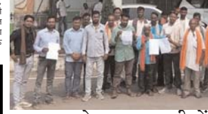
पंतोरा। गाँव के कई घरों में अब नल नहीं लगाया गया है। इससे लोगों को पेयजल के लिए परेशानी हो रही है।