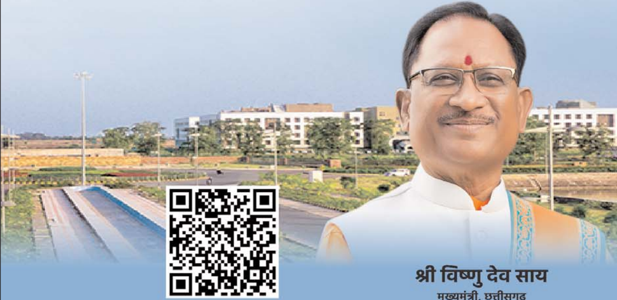
श्री विष्णु देव साय मुख्यमंत्री, छत्तीसगढ़

छत्तीसगढ़ के विकास के लिए अपने सुझाव एवं विचार राज्य नीति आयोग के नागरिक पोर्टल पर QR कोड स्कैन कर साझा करें