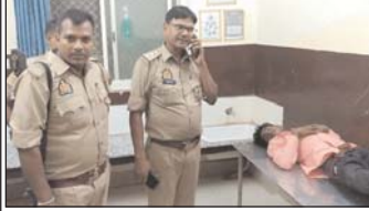
लालगंज-प्रतापगढ़, 08 अक्टूबर (एजेंसी)।

खेत में कब्रती चरणे गई किशोरी के साथ हेवनियारत करने वाले को पुलिस ने सबक सिखा दिया। घटना के