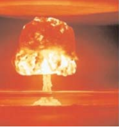
नईदिल्ली, 08 अक्टूबर (एजेंसी)।

ईरान में रहस्यमयी भूकंप से दुनिया हैरान है। अब कयास ये लगाया जा रहा है कि सच में यह भूकंप था या ईरान ने पहली बार परमाणु बम का परीक्षण किया है।