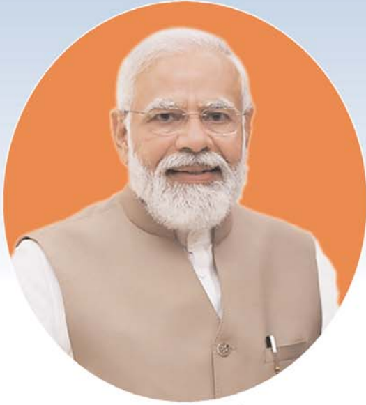
श्री नरेन्द्र मोदी माननीय प्रधानमंत्री