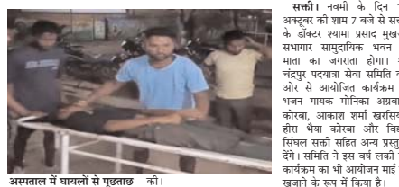
जांजगीर-चाँपा। जिला मुख्यालय के जांजगीर-चाँपा जिले में तेज रफ्तार ट्रैक्टर से एक नवजाति को कुचल दिया।

जांजगीर-चाँपा। जिला मुख्यालय के जांजगीर-चाँपा जिले में तेज रफ्तार ट्रैक्टर से एक नवजाति को कुचल दिया। घटना पामाड़ धाना क्षेत्र के ग्राम कुटराबोड़ की है।