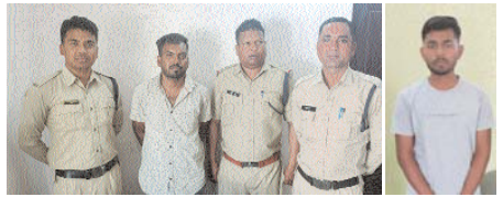
पुलिस गिरफ्तार में दुष्कर्म का आरोपी व सटोरिया।

कोरबा। लोकपाल प्रकरणों को निराकरण करने के लिए जिले की पुलिस ने दुष्कर्म और सटोरिया को गिरफ्तार कर जेल भेजा है। दुष्कर्म और सटोरिया को गिरफ्तार कर जेल भेजा है।