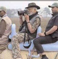
अरुण, 09 मार्च [एअ्रैली]

प्रधानमंत्री नरेंद्र मोदी अरुण के तट पर हैं। प्रधानमंत्री नरेंद्र मोदी ने सहाय-सुहाय काजीरंगा नेशनल पार्क का दौरा किया। यहाँ उन्होंने जंगल सफारी का भी इंतजाम देखा। यहाँ नहीं पीएम मोदी ने हाथी पर बैठाकर काजीरंगा नेशनल पार्क की खूबसूरत तास्वीकों को भ्रमण में भी देखा किया। पीएम मोदी ने काजीरंगा नेशनल पार्क के तट पर चूड़ी कूड़ा तास्वीकों को संग्रहित किया। प्रधानमंत्री अरुण पर शेरार थियमा। उन्होंने देखासिमाओं से अरुण और काजीरंगा नेशनल पार्क की खूबसूरत तास्वीकों को भ्रमण में भी देखा किया। पीएम मोदी ने अरुण और काजीरंगा नेशनल पार्क का दौरा भी किया। पीएम मोदी ने अरुण और काजीरंगा नेशनल पार्क का दौरा भी किया।