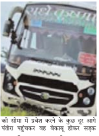
को सीमा में प्रवेश करने के कुछ दूर आगे चोपारा पहुंचकर वह बेकाब होकर सड़क

कोरबा। रायपुर जा रही एक निजी ट्रेवलिंग कंपनी की यात्री बस आज सुबह अर्धरात्रि तक होकर दुर्घटनाग्रस्त हो गई। 3 यात्रियों की गंभीर चोट आने पर मेडिकल कॉलेज हास्पिटल में भर्ती कराया गया है, जबकि 24 यात्रियों को सामान्य चोट आने पर प्राथमिक चिकित्सा के साथ छुट्टी दे दी गई। घटना को लेकर माना जा रहा है कि रात्रि में चालक को झपका केने के पचास में यह बस हुआ। आज सुबह 3.30 बजे यह हादसा जिला मुख्यालय कोरबा से 24 किमी दूर कनको-बेलौती मार्ग पर हुआ। अंबिकापुर से यात्रीयों को लेकर राधेकृष्ण ट्रेवलस की बस संख्या सीजी-14-1154 रायपुर जा रही थी। बस में लगभग 50 यात्री सवार थे। रात्रि 1 बजे अचानक के दौरान यात्री बस कोरबा जिले की सीमा से पार हुई। जांचगैर-चोपा जिले