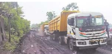
भारी वाहन नों का परिचालन बाधित रहेगा। नगर पालिका कोरबा के गौरव पर चल रहे कोयला परिवहन के ट्रैकों को लेकर आज विगत 25 दिनों तक प्रदरन किया गया। इस बीच संघर्ष समिति के द्वारा नगर पालिका को

कोरबा/दीपाका। पूर्ववर्ती भाषणा सरकार के कार्यकाल में एक कोडो के लागत से कोयलांचल दीपाका के अंतर्गत नगर पालिका क्षेत्र में तैयार किये गए गौरव पथ को बहाल स्थिति को देखकर एका विस्कूल नहीं लाता कि इस पर गंव करने लायक कोई विषय भी है। परसखेले को खदान से कोरबा लेकर निकलने वाले वाहनों ने इसकी सुनिट कर रखा है। चौराहा स्थान बनने के बाद नगर पालिका ने बस पर गाँव वाहनों की सुरक्षाकर्म के लिए सामान्य पथ में चर्चा करने को मांसिखता पहली बार बनाई है। अभी से अदरलत लगाई जा रही है कि केसला परिदरनकाओं के लिए गहरत देने वाला होगा या फिर जगन के लिए। कोयलांचल दीपाका में गौरव पथ पर बनाई हुआ आवागमन से संबंधित समस्याओं के कारण आम लोग परेशान हैं। इससे छुटकारा पाने के लिए गौरव पथ संघर्ष समिति बनाई गई। एक व्यक्तिक को मौत के बाद बहाल लोगों ने अतसा शुरू किया। लोगों के तैवर के बाद प्रशासन केकेपुट पर आ गया। आधिकारिक रव किया गया कि आगेअ व्यवस्था तक गौरव पथ पर हर दिन सुबह और शाम तीन-तीन घंटे