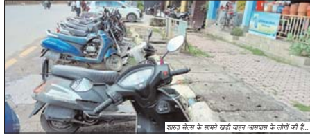
शाहरुम सेस के सामने खुली बजा अल्पसम के लोगों की है...

कोरबा। त्योहार का सौजन्य शुरू होने के साथ विभिन्न क्षेत्रों में पुलिस के द्वारा कार्रवाई की जा रही है। इस दौरान यातायात व्यवस्था को विनाशित वाले वाहन चालकों के खिलाफ एक्शन लिया जा रहा है। सौपरसिधी चौराहे के नजदीकी कुछ दुकानों के सामने आपसव के कारोबारों के द्वारा कर और वाइरुड कडर देने के कारण समस्या पैदा हो रही है और दुकानदारों पर बोझा असर पड़ रहा है। दुकानदारों नार से सौपरसिधी चौराहे को जाने वाले रास्ते पर बड़ी संख्या में व्यवसायिक संस्थान पहले से खुले हुए हैं और अब इनमें नए गिरि से बढोती हो रही है। कारोबारों ने अपने साथ के लिए कई प्रकार की वैरायटी दुकानों में रखी है लेकिन वहां पर आने वाले ग्राहकों के बढोती में को खूब तक प्रभावित हो गया है। वहाँ संख्या में कर और दुर्घटिया के साथ वहां पहुंचने वाले ग्राहकों के द्वारा शराद सेलस के सामने के परिसर में अवेध तरीके से गाडियों को पार्क किया जा रहा है। ऐसे में इस