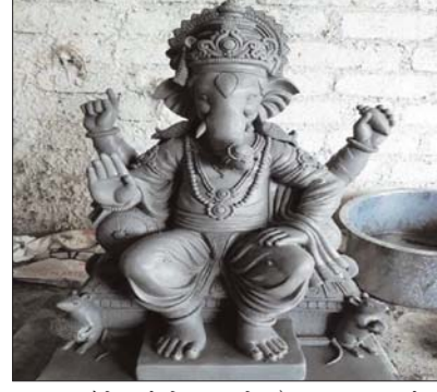
यह व्यवसाय हमारे लिए काफी सुविधाजनक है और स्वयंसे अखली वचा यह है कि लोग इस मामले में किसी प्रकार का मोलभाव करने को उद्यत नर्यात नहीं रहते।

विभिन्न व्यवसाय को रूढ़ती हे प्रतिष्ठा कोरबा। भाद्रपद मास की चतुर्थी से विघ्न विनाशक भावना गणेश का महोत्सव शुरू हो रहा है। शहरी और गामरैड क्षेत्र में इसके लिए तैयारी का मिलसिला जारी है। इस उत्सव के अंतर्गत कई प्रकार के व्यवसायों की आर्थिक मजबूती मिलती है इसलिए संबंधित उद्यमियों को इस पर्व को काफी प्रतीक्षा रहती है। आडोताइक जिले कोरबा में शहरी के साथ-साथ ग्रामीण क्षेत्रों में गणेश उत्सव पूर्ण रूपसे शुरु हो चुका है। इस पर्व पर मूलतः अलख कई जा रहे हैं। विघ्नकर्मा, गणेश और दुर्गा पूजा के बाद देवपूजाओं पर ध्यान देने वाली देवीपूजाकार, मिट्टी के दीपकों से शिल्पकारों को नौविकर पण्डू जीवन पर सुनिश्चित होती है। कोरबा जिले में लाखों रुपए कीमत की जामिया हाथी-हाथ आरंभकों को मुहैया हो जाती है। शिल्पकार बताते हैं कि स्थानीय स्तर पर