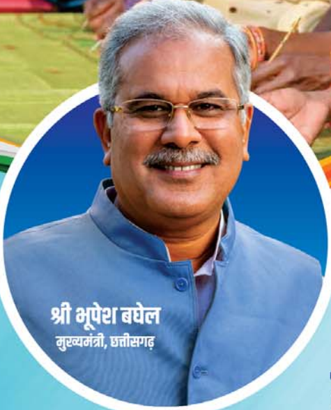
श्री भूपेश बघेल मुख्यमंत्री, छत्तीसगढ़