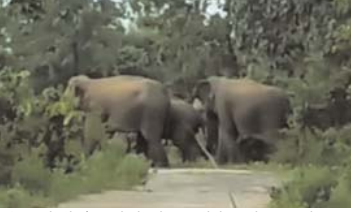
नदी आ रहे रहे हैं जिससे क्षेत्र में हाथियों की फिर बड़े हमले की संभावना बढ़ी हुई है। इस बीच हाथियों का दल लाल पुर क्षेत्र में अग्रणी उपस्थित दिख कराने के बाद कोरबी सफिकल अंतर्गत खूरुपापा पहुंच गया है।

कोरबा। वन मंडल कोरबा के केन्द्र रेंज के कोरबी सफिकल में 3 दर्जन से अधिक हाथी सक्रिय हैं। और जंगल में विचरण करने के साथ खेतों में पहुंचकर फसलों को भी भारी नुकसान पहुंचा रहे हैं। इन हाथियों की फोटोग्राफी करने, विडियो बनाने तथा सेल्फी लेने के लिए बड़ी संख्या में ग्रामीण घरों में निकलकर जंगल पहुंच जा रहे हैं। जिससे खतरा बढ़ गया है।