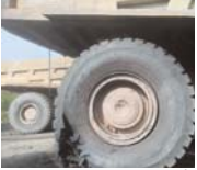
लड़ित नहीं लगा है क्षेत्र में

कोरबा। भारत सरकार के लाभकारी सार्वजनिक उपक्रम साठह ईस्टर्न कोयलाखन लिमिटेड की दोपका खदान विस्तार में पिछली रात वज्रपात हो गया। इस घटना में 240 टन क्षमता वाले दो भारी डम्पर प्रभावित हुए। एक का टायर फटने के अंतर से बल्ले के डम्पर के कांच टूट गए। और भी स्तर पर वही नुकसान हुआ। 10 टन सुरक्षा प्रबंध नहीं करने के कारण यह घटना हुई है।