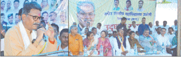
मुख्यमंत्री ने भेंट मुलाकात कार्यक्रम में की थी नवीन महाविद्यालय शुरू करने की घोषणा

कोरबा। मुख्यमंत्री श्री भूपेश बघेल द्वारा ग्राम चिरों के भेंट मुलाकात में किए गए घोषणा के तहत जिले के सीमावर्ती ग्राम उमरेली में नवीन शालाको महाविद्यालय का आज से शुभारंभ हो गया। मुख्य अतिथि डॉ चरणलाल महंत, अध्यक्ष छत्तीसगढ़ विधानसभा ने नवीन महाविद्यालय का उद्घाटन किया। इस दौरान उन्होंने कहा कि उमरेली जैसे गांव में कॉलेज का खुलना एक बड़ी उपलब्धि है। यह सब क्षेत्र के लोगों के प्रयास और मुख्यमंत्री की वकाल से हो पाया है। इस कॉलेज में उमरेली सहित आसपास गांव के सभी बच्चे पढ़ेंगे। उन्होंने सभी से अपील करते हुए कहा कि आप सभी लोग अपने-अपने बच्चों को पढ़ने के लिए अथय भेजे और यहाँ