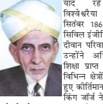
याद रहे मोक्षगुण्डम विश्वेश्वरैया का जन्म 15 सितंबर 1861 को भारतीय स्थिति इंजीनियर व मेसूर के दीवान परिवार में हुआ था। उन्होंने अभियंताओं की शिक्षा प्राप्त करने के साथ विभिन्न क्षेत्रों में काम करते हुए कौशलियन स्थापित किये।

कोरबा। राष्ट्रीय और अंतरराष्ट्रीय स्तर पर अपने अभियंताओं को कौशल का प्रदर्शन करने वाले मानव अभियंता मोक्षगुण्डम विश्वेश्वरैया को आज उनके 162वें जन्मदिन पर कोरबा में याद किया गया। यहां के आयु गांधी स्थित विश्वेश्वरैया प्रतिभा स्थल पर शहीदोत्सव दिवसीय इंजीनियर एसोसिएशन और कोरबा इंस्टिट्यूट इंजीनियरिंग आर्किटेक्चर एसोसिएशन ने उज्ज्वलित बंद कराकर श्रद्धा समुन अर्पित किये।