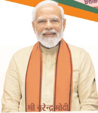
श्री नरेन्द्र मोदी माननीय प्रधानमंत्री