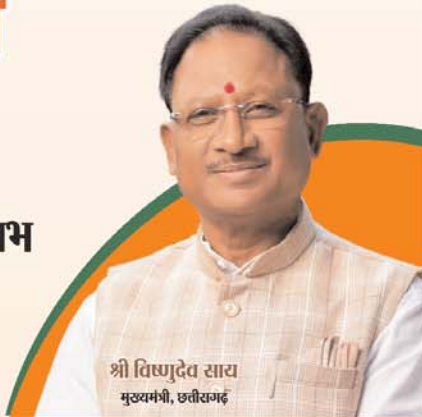
श्री विष्णुदेव साय मुख्यमंत्री, छत्तीसगढ़