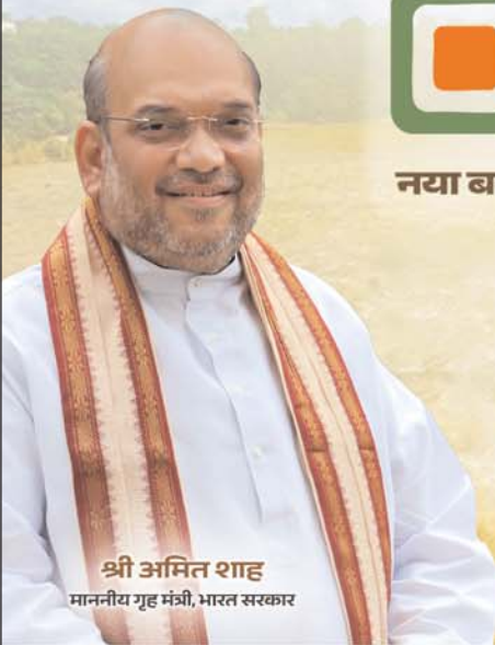
श्री अमित शाह माननीय गृह मंत्री, भारत सरकार