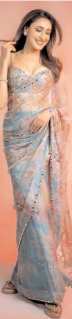
बॉलीवुड एक्ट्रेस प्रज्ञा जैसवाल आए दिन अपनी लेटेस्ट फोटोशूट को तस्वीरें इंस्टाग्राम पर पोस्ट कर अक्सर फैंस को अपना संबाना बना देती हैं। उनका हर

एक लुक इंटरनेट पर आते ही तेजी से वायरल होने लग जाता है। अब हाल ही में एक्ट्रेस ने अपने लेटेस्ट फोटोशूट को तस्वीरें फैंस के बीच साझा की हैं। इन फोटोज में उनका कालिलाना अनावार खूबसूरत फैंस एक बार फिर से अपने होश खो बैठे हैं। एक्ट्रेस प्रज्ञा जैसवाल ने अपने करियर में अबतक 14 से ज्यादा फिल्मों, सीरियल और सोरोज में काम किया है। वो भले ही इन दिनों किसी फिल्मों में नहीं नजर आ रही हैं, लेकिन आए दिन अपनी तस्वीरों से फैंस का सारा ध्यान अपनी ओर खींचती रहती हैं।