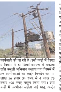
कार्यवाही को जा रही है। इसी कड़ी में विभाग 5 दिसंबर से ही शिवलीनारायण में बकाया राशि वसुली अधिचारीयों का लाइव विच्छेदन किया जा रहा। 490 रूपए बसुली किया गया। इसी कड़ी में उपभोक्ता सहज साई साई अनुंन

शिवलीनारायण। विद्युत विभागी का अमला इन दिनों बिजली चोरी मुहदौ हो गया है। इसी कड़ी में पांच दिनों के भीतर 69 बकायादासों का विद्युत कनेक्शन कानने को काटबाई की गई। इसके साथ ही शिवलीनारायण विद्युत विभागी द्वारा निर्गत सभन अधिचारी चलकर बसुली को जा रही है। विद्युत ही कि शिवलीनारायण वितरण केंद्र में 12 हजार 500 उपभोक्ताओं के विच्छेदन 17 करोड बकाया राशि है। जिसमें शासकीय उपभोक्ताओं के विच्छेदन 11 करोड 62 लाख एवं अरासकीय के विच्छेदन 5.41 करोड बकाया राशि है। उपत्य अधिचारीयों के निर्देशानुसार अरुणकुंडी उपभोक्ताओं से उक राशि वसुली सुली हेतु हेतु निर्गत सभन अधिचारीयों में 69 उपभोक्ताओं का लाइव विच्छेदन किया जा रहा। जिसमें व्यवसायिक अधिकाारी उपभोक्ताओं का भुगतान नही होने की स्थिति में तत्काल लाइव विच्छेदन करने की