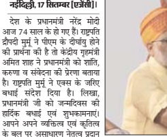
नई दिल्ली, 17 सितंबर (एजेंसी)। देश के प्रधानमंत्री नरेंद्र मोदी आज 74 साल के हो गए हैं। राष्ट्रपति द्रौपदी मुर्मू ने पीएम के दीर्घायु होने की प्रार्थना की है तो केंद्रीय गुप्तचर अिमत शाह ने प्रधानमंत्री को शांति, कल्याण व सवेदना की प्रेरणा काताया है। राष्ट्रपति मुर्मू ने एक्स के जारिए बधाई संदेश दिया है। लिखा, प्रधानमंत्री जी को जन्मदिवस की हार्दिक बधाई एवं शुभकामनाएं। आपने अपने व्यक्तित्व एवं कृतित्व के बल पर असाधारण नेतृत्व प्रदान किया है तथा देश की समृद्धि और प्रगति में वृद्धि की है। मेरी कामना है कि आपके द्वारा राष्ट्र प्रथम की भावना से किए जा रहे अभिनव प्रयासों से भारत को एक

विकसित राष्ट्र बनाने का मार्ग प्रशस्त हो। मैं ईश्वर से प्रार्थना करती हूँ कि आप दीर्घायु हीं तथा स्वस्थ स्वस्थ और सान्ने रहें। देश के गुप्तचर अिमत शाह ने सावडुगोड टाइल के जारिए अपनी भावनाएं प्रेषित कीं। कहा, मोदी जी ने 'नए भारत' के विजन के साथ विरासत से लेकर विमान तक को जोड़ा है। उन्होंने अपने दृढ़ इच्छाशक्ति व जनकल्याण के संकल्प से अनेक संसंधन से लाने वाले कर्मों को सभर बनाकर गरीब कल्याण के नए कौशलगत रचे हैं।