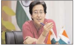
केजरीवाल और अन्य बड़े नेताओं की मेमोरीजुटो में दिल्ली की चुनने से आतिशी ने ही संवाद किया। गैरमौजूदगी का समना भी किया। केजरीवाल की नजर में आतिशी का कितना महत्व है, यह इस बात से भी साफ होता है कि उन्हें 15 अगस्त को ड्राइव नहीं फहरा सकी।

नई दिल्ली, 17 सितंबर (एजेंसी)। आतिशी मार्लेना दिल्ली की अगली मुख्यमंत्री होंगी। मंगलवार को राजधानी में हुई विधायक दल की बैठक में सभी विधायकों और बड़े नेताओं ने उनके नाम का समर्थन किया। आतिशी का नाम नए मुख्यमंत्री की लिस्ट में सबसे आगे था। इसके पीछे कारण यह था कि शराब नीति कांड में अरविंद केजरीवाल के जेल जाने के बाद दिल्ली के एक दर्जन मंत्रालय आतिशी ने संभाले।