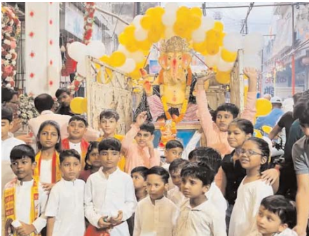
बारादात। विदाई का दौरे... गणपति बय्या मोरवा अगले बरस जल्दी आ के नारे लगे