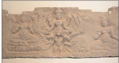
बलुआ पत्थर से निर्मित एक आकटिकवल्चर पैनल में भगवान विश्वकर्मा ( 10वीं शताब्दी ); बीच में गडगुड पर विराजमान विष्णु हैं, बायाँ दायें तरफ भगवान विश्वकर्मा हैं।

है। अतः सर्वो विश्वकर्माओं को प्रजापुत्र व धर्मशास्त्रात्मी, विश्वकर्मा जो से सम्बन्धी सत्यार्थी, संघ व समितिओं को प्रजापुत्र पतिरि कर्के भात सरकार से मांग जानी चाहिए। को सम्पूर्ण संस्कृत साहित्य का अवलोकन किया जाय, भारत को विधि यूनोसैडोको में इस विषय पर भी ध्यान दी जानी चाहिए, विदेशों में भी खोजो को जाय, तथा भारत सरकार विश्वकर्मा चर्याि को संवेक्षण फिलो प्रमुख मीडिया एजेंसी से कर्वायें। श्रुति का वचन है कि विवाह, यज्ञ,