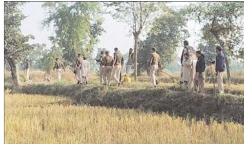
नाप नहीं बनी तो दूसरे तरीके उपयोग में लाये गये। बताया गया कि किसानों को हटाने के कारण हाईवे का निर्माण अपने निर्धारित दिनों में अटका रहा है।

कोरवा। बिलासपुर-अधिकार नेशनल हाईवे संख्या 130-बी का निर्माण कार्य कुछ दिनों में हो चुका है और कुछ में जारी है। जुराली में सड़क निर्माण के लिए दो किमी की जमीन को लेकर विवाद का स्थिति कायम है।