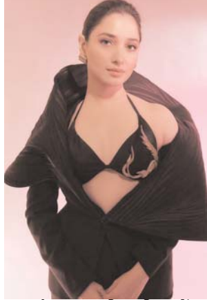
ब्लैक आउटफिट फिट में तमन्ना भाटिया ने ढाया कहर

तस्वीरों देखा एक्ट्रेस के दौरान हुए फैसलअब हाल ही में इस एक्ट्रेस ने अपने ब्लैक लुक को कुछ तस्वीरों में भी देखा है, जो सोशल मीडिया पर लोगों को खूब दीवानी बना रही हैं।