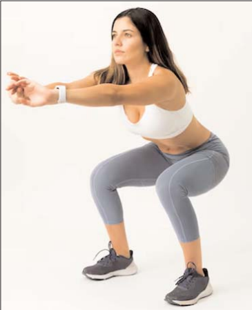
सही तरीके से सांस लेने से ऊर्जा भी बनी रहती है, जिससे आप अधिक समय तक एक्सरसाइज कर सकते हैं। निश्चितता बनाकर रखें

सही तरीके से सांस लेना भी इस एक्सरसाइज का अहम हिस्सा है। जब आप नीचे बैठ रहे हैं, तो धीरे-धीरे सांस लें और जब आप वापस खड़े हो रहे हैं, तो धीरे-धीरे सांस छोड़ें। ऐसा करने से आपके मांसपेशियों को पर्याप्त ऑक्सीजन मिलता रहता है, जिससे आप थकान महसूस नहीं करेंगे और आपको बेहतर परिणाम मिल सकेंगे। इसके अलावा,