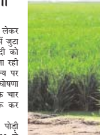
अनुविभाग की सभी वहालों में आने वाले हल्कों के पटवारीयों को अपने क्षेत्राधिकार के कुपि रकबा का सत्यापन करने की बिम्बदारी दी गई है। राखरव को माघ में इसे गिरदावरी का नाम दिया गया है। निर्धारित मानक के अंतर्गत पटवारी और अन्य संबंधित क्षेत्र में पहुंचकर विजिट

कोरबा। चुनावी वर्ष 2023 को लेकर प्रशासन संबंधित कार्यों की तैयारी में जुट हुआ है। इसी के माध्यम धान खरीदी को लेकर भी औपचारिक तैयारी की जा रही है। हातांकि अब तक समर्थन मूल्य पर धान खरीदी के लिए सार्विक घोषणा नहीं हुई है लेकिन कोरबा जिले के चार अनुविभाग ने गिरदावरी कार्य शुरू कर दिया गया है। कोरबा, कटघोड़ा, पाती और पोड़ी उपखंड अनुविभाग के अंतर्गत 200 से ज्यादा पटवारी हल्का शामिल हैं, जहाँ की खेती बड़े पैमाने पर कुपक करते हैं। पिछले वर्ष 11 हजार के आसपास किसानों ने अपना धनोक्ति धान बेचने के लिए कराया था और सार्वजनिक मूल्य के साथ धान खरीदने की तैयारी में इस हेतु अमली प्रक्रियाएं जारी हैं। इसके अंतुत्तर