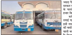
अंबाला शहर, 19 फरवरी (एजेंसी)।

हरियाणा रोडवेज अंबाला हिंदु से पंजाब की मानव आवाज एक पंजाब सरकार को रोजाना पैसों के टैक्स के रूप में एक लाख रुपये दे रही है।