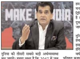
दुनिया की तीसरी सबसे बड़ी अर्थव्यवस्था बन जाएगा। अमराज लखर ने कि 2047 में जब

मुंबई, 19 फरवरी (एजेंसी)। भारत को अगर 2047 तक 35 ट्रिलियन डॉलर की अर्थव्यवस्था बनना है तो तीन दशकों तक उसकी इकोनॉमी 9-10 प्रतिशत की दर से बढ़नी चाहिए।