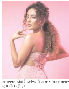
आयक्यकता होती है, इसलिए मैं हर समय आत्म-जागरूक रहना सीख रही हूँ।