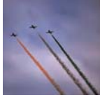
सिंगापुर, 19 फरवरी (एजेंसी)।

भारतीय वायुसेना की सांख्यिकीय टीम सिंगापुर एयरशो में भाग लेगी। इस दौरान वेक गणराज्य और कोरिया जैसे 16 देश ले रहे भाग लेंगे।