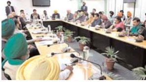
चंडीगढ़, 19 फरवरी (एजेंसी)।

फसलों के अनुमान सम्बन्ध मूल्य और किसानों की कर्जों माफी सहित अन्य मांगों को लेकर चंडीगढ़ में रविवार रात किसान नेताओं की एक बैठक हुई थी। इसमें किसानों ने चार घंटे चली बैठक में किन मुद्दों पर चर्चा की। बैठक में किसानों ने चार घंटे चली बैठक में किन मुद्दों पर चर्चा की।