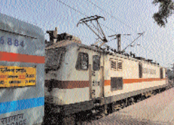
मंडी-कांयोगुड़ा सेक्शन में ट्रैफिक ब्लॉक के कारण एक पखवाड़े तक रुक रहेगी। एक्सप्रेस गाड़ी के लंबे समय तक रुक जाने से यात्रियों को भारी असुविधा का सामना करना पड़ेगा। उर्ध्व अंगाथ यात्रा के लिए एन गाड़ीवहन व सभ्य का सहारा लाना पड़ेगा। इसी प्रकार 21 जनवरी को 02:10 विनासपुर-कोरबा पैसंजर स्थानी भी रोक की अनुभवकर्ता के कारण रुकेंगे। रेलवे के सूत्रों ने बताया कि इसी तरह दक्षिण एक्सप्रेस परिवर्तित मार्ग व्याज काजीपेट- मुद्रकल- धनवरम से चलेंगे।

कोरबा। उत्तर-पूरु रेलवे के आगरा स्टेशन अंतर्गत पखवाड़े का आधुनिकीकरण किया जा रहा है। इस नए इंटरलॉकिंग कार्य के चलते कोरबा व आसपास के बीच चलने वाली कोरबा एक्सप्रेस 21 जनवरी से 4 फरवरी अर्थात् एक पखवाड़े तक रुक रहेगी। एक्सप्रेस गाड़ी के लंबे समय तक रुक जाने से यात्रियों को भारी असुविधा का सामना करना पड़ेगा। उर्ध्व अंगाथ यात्रा के लिए एन गाड़ीवहन व सभ्य का सहारा लाना पड़ेगा। इसी प्रकार 21 जनवरी को 02:10 विनासपुर-कोरबा पैसंजर स्थानी भी रोक की अनुभवकर्ता के कारण रुकेंगे। रेलवे के सूत्रों ने बताया कि इसी तरह दक्षिण एक्सप्रेस परिवर्तित मार्ग व्याज काजीपेट- मुद्रकल- धनवरम से चलेंगे।