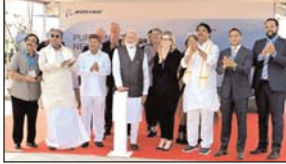
प्रधानमंत्री नरेंद्र मोदी के कार्नाटक के मुख्यमंत्री सिरसायें राज्यपाल धारद वंदं बहालौर और जय लामों के साथ वेणुसुतु, कार्नाटक में बोडिंग इंडिया डेजीनिंगविंग एर देरनेलोकोी सेटर (बीआईएडीटी) परिसर का उद्घाटन किया।