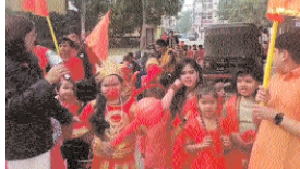
समाज को एकजुट करने में अपनी बुद्धिमत्ता निभाए। इसी बुद्धिमत्ता और अतिथि के अंतर्गत विभिन्न क्षेत्रों में स्थित मंदिरों की साफ सफाई भी की गई। राम मंदिर प्राण प्रतिष्ठा दिवस के लिए 48 घंटे तक समाज को एकजुट करने के लिए नर और जिले के सभी देवालयों में अनेक प्रकार के अनुष्ठान के साथ भजन कीर्तन का सिलसिला लंबे समय तक चलेगा। पौष दशरथी की श्री राम मंदिर के प्राण प्रतिष्ठा दिवस के लिए विशेष तैयारी की जा रही है। बड़ी संख्या में भक्तगणों की उपस्थिति यहां पर सुनिश्चित होगी। आभय और खास के बीच की दूरी इसके माध्यम से मिटेंगी।

कोरबा। संभवतः ऐसा पहली बार होगा जबकि नार और जिले के सभी देवालयों में अनेक प्रकार के अनुष्ठान के साथ भजन कीर्तन का सिलसिला लंबे समय तक चलेगा। पौष दशरथी की श्री राम मंदिर के प्राण प्रतिष्ठा दिवस के लिए विशेष तैयारी की जा रही है। बड़ी संख्या में भक्तगणों की उपस्थिति यहां पर सुनिश्चित होगी। आभय और खास के बीच की दूरी इसके माध्यम से मिटेंगी।