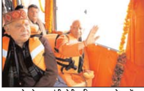
उत्तर प्रदेश के मुख्यमंत्री योगी आदित्यनाथ अयोध्या में सखु नदी पर पहली छत पर लगी सोन नाव के उद्घाटन के दौरान।