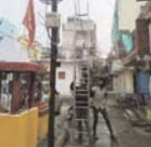
कोरबा। नगर पालिका निगम के विद्युत क्षेत्र के द्वारा आज महाराणा प्रताप नगर में स्ट्रीट लाइट सुधार के लिए कार्य किया गया। समय से पहले पर समस्या कहे हुई थी और वहां में आवासीय को लेकर लोग परेशान हो रहे थे। स्थानीय प्रताप आगा जयरावल के द्वारा इस बारे में निगम के अधिकारियों से विचार के साथ साथ कार्यवाही करने के लिए कहा गया था। इस पर संज्ञे लिया गया कि संधायण टीम को इस क्षेत्र में भिजवाया गया। समन्यग्रस्त इलाके को गहनता करके के साथ जकड़ी सुधार कार्य किए गए। तकनीकी गड़बड़ी को ठीक करने के साथ-साथ कई मामलों में लिंकव लाइट बदली गई। अपनी नगर के विचार क्षेत्रों में इस असावा हो सक।