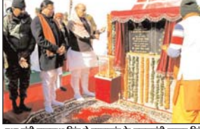
रेवा मंत्री राजगया सिंह ने जयप्रताप के मुख्यमंत्री पुकर सिंह शाही के साथ जयप्रताप में जोशीमह-मलारी (डीएर एर जयप्रताप) एक कार्नाटक में सीमा सुक संघर्ष (बीआरओ) की 35 सुविधायें तथा परियोजनाओं का उद्घाटन किया।