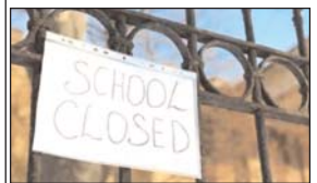
विशाल संयुक्त अनुपलवत नहीं करगे तो सखा कार्रवाई की जाएगी। सखुमों के इन पर जालेख उभरना है। कहा कि तामपन में गिरावट आने पर स्कूल और कॉलेज फिर से खोलने के आदेश जारी किए जा सकते हैं।

गुनेखर, 23 अप्रैल [एजेंसी।] राज्य में बड़ी गर्मी को देखते हुए बुधवार से राज्य में स्कूल और कॉलेज बंद घोषित कर दिए गए। राज्य से एक आयुध प्रबंधन मंत्री सूत्रों परार ने मालतार को इसकी घोषणा की है। मंत्री पुजारी ने कहा कि स्कूल और कॉलेज अगले आदेश तक बंद रहेंगे। राज्य मंत्री ने कहा कि बुधवार से आंगनवाड़ी केंद्र भी बंद रहेंगे। सूत्र 7 बजे से 8.30 बजे तक चलने वाले आंगनवाड़ी केंद्र बंद रहेंगे। आंगनवाड़ी के बच्चों का भोजन उनके घरों तक पहुंचाया जाएगा। गर्मी की लहर को देखते हुए यह कदम उठया गया है। हालांकि, वे छत्र जो हॉस्टल में रह रहे हैं, वे हॉस्टल में बलूत कर सके हैं। पहले के शेकुलर के अनुभार, परीक्षाएं जारी रहेंगी जेस कि उन्हें माना जाता था। दिवालीवर्ति सरकारी और निजी शिक्षण संस्थानों पर लागू होंगे। निजी उकरणों के लिए आदेशों के तहत बंद उठया गया है। मंत्री सूत्र पुजारी ने मामले में अतिरिक्त जांच के आदेश दिए। अमित शहा ने कहा कि इस जलय आतंकी हमले में शामिल लोगों की बखला नहीं जाएगी और हम अकरणों पर कड़ी कार्रवाई करेंगे और उन्हें कड़े से कड़ी सजा देंगे।