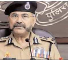
काश्या में बलजीवी प्रताप कुमारे ने वरिष्ठ पुलिस अधिकांरीयों से बलत कर संवेदनशील शरणों में भीड़-भाड़ वाले स्थानों पर पुलिस सखत बलूत जाने का निर्देश दिया है। एक उच्च स्तरीय बैठक में सभी जिलों में सदिधियों की निगरानी बलूत जाने व हर छोटी सूचना को भी वरिष्ठ अधिकारियों से सखा किए जाने का निर्देश दिया गया। महाकुंभ के दौरान खालिस्तानी आतंकी संयुक्त व अहमदाबाद ने हमले का पहाद बलूत था। एस्पडीएफ ने खालिस्तानी आतंकी लखत महीह को कोशायी से गिरफ्तार किया था। प्रेसरा में आतंकीयों का नेटकन गहरा है।

लखनऊ, 23 अप्रैल [एजेंसी।] जम्मू-कश्मीर के पहलगाय में हुए आतंकी हमले के बाद सूचना एजेंसीय अलर्ट हो गई है। अयोध्या, मथुरा-काशी समेत प्रमुख धार्मिक व पर्यटन स्थलों पर अतिरिक्त सखनका बरते जाने का निर्देश दिया गया है। ऐसे सभी स्थलों पर चेकिंग बढ़ाए जाने के साथ ही सदिधियों पर कड़ी नजर रखे जाने का निर्देश दिया गया है। प्रमुख धार्मिक व पर्यटन स्थलों पर पहले से कड़ी सुरक्षा प्रबंध हैं। जम्मू-कश्मीर में हुई घटना के बाद सुरक्षा प्रबंधों की समीक्षा किए जाने के साथ ही चौकसी बढ़ाई गई है। सूत्रों का