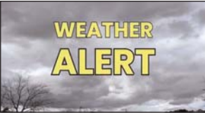
नईदिल्ली, 23 जुलाई [एजेसी]

नेपाल के तीन बैराजों से करीब दो लाख क्यूसेक पानी छोड़े जाने से उत्तर प्रदेश के मऊ, बलिया और आजमगढ़ में सरु नदी उफान पर है। मऊ में सरु नदी के निशान बिंदु 69.90 से 20 सेंमी से ऊपर बढ़ गई है। बलिया में नदी का जलस्तर रामगढ़ सुहर खरते के निशान 64.10 मीटर पर पहुंच गया। आजमगढ़ में पानी खरते के निशान बिंदु को पार कर गया है और प्रति घंटा दो सेंमी की गति से बढ़ रहा है। उत्तर, उत्तरांचल में भारी वर्षा के कारण चारधाम क्षेत्र गम पर परेशानियां बढ़