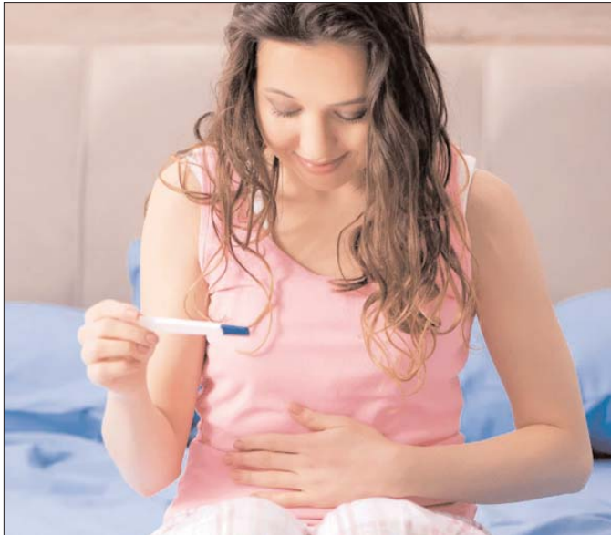
जल्दी है, अपने दिनचर्या में एक्सरसाइज और फीटिक-संतुलित आहार को शामिल करने से इस समस्या को घेचा जा सकता है.

पीसीओएस का इलाज अगर किसी महिला को पीसीओएस की समस्या है तो सबसे पहले उसे अपनी जीवनशैली में बदलाव करना चाहिए, अगर वजन बढ़ रहा है तो उसे नियंत्रित करना सबसे