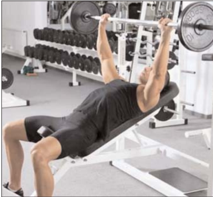
प्रतिरोधी ग्राम-पेगेटिव रॉड्स ट्रेडमिल, एक्सरसाइज बाइक और फ्री वेट पर पाए गए थे. खास तौर पर

स्टडी में बताया गया कि ग्राम-पॉजिटिव कोकस जैसे बैक्टीरिया, जिम जाने वालों में स्किन इन्फेक्शन का कारण बन सकते हैं. ट्रेटोबाक्टिक-