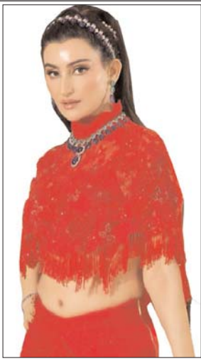
फैबुलस लाइव्स वरसे बॉलीवुड वाइव्स सीजन 3 की शालिनी पासी की लाइव रूइलन सबसे हटकर

अतिरिक्त सुरक्षा के लिए वर्कआउट के तुरंत बाद जिम के कपड़े बदलने की भी सलाह दी जाती है. जबकि एक वर्कआउट बाइक और ट्रेडमिल की सफाई, जो हर जिम-एक्विपमेंट के सर्वोच्च इन्फर्मेण्ट है. इस स्टडी में पाया गया है कि व्यायाम वाली बाइक और ट्रेडमिल में सार्वजनिक स्थानों और यहां तक कि फेरेटरीया ट्रे की तुलना में लगभग 39 और 74 गुना अधिक बैक्टीरिया होते हैं. ऐसे में सावधानी बेहद जरूरी है.