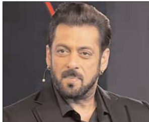
सलमान खान ने लामातार हिट फिल्मों देने वाले अक्षय कुमार फिल्ने कानी सपना से बॉक्स ऑफिस पर अफेक्लताओं को सामना कर रहे हैं. इस साल 2024 में उनकी एक फिल्म रिलीज हुई. लेकिन जो भी बॉक्स ऑफिस पर कुछ खास कमाल नहीं कर पाई. फिल्म बॉक्स ऑफिस पर फ्लॉप हो गई. इसके अलावा उनकी फिल्म अपने बावट जितना भी नहीं कमा पाई. हालांकि अब फिल्में ओटीटी पर स्ट्रीम हो चुकी हैं. जहां ये धूम मचा रही है। फिल्म को काना अच्छा रिस्पॉन्स मिल रहा है।