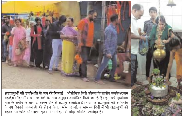
ब्रह्मालुओं को उपस्थिति के बन रहे रिकार्ड : औद्योगिक जिले कोरबा के प्राचीन कनकेरधाम महादेव मंदिर में सायन पर सेले के साथ अरुण आओजिन किया जा रहे हैं। इस वर्ष पुरोधाम मास के संयोग के साथ तो सावन होने से ब्रह्मालु उरसाहित हैं। यहां पर ब्रह्मालुओं को उपस्थिति के नए रिकार्ड कायम हो रहे हैं। न केवल सोमवार बल्कि सामान्य दिनों में भी ब्रह्मालुओं की बेहतर उपस्थिति और दर्शन पूजन में भागीदारों से मॉडर समिति उरसाहित है।