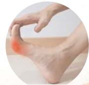
नाखूनों को नियमित रूप से ट्रिम करें और उन्हें छोटा रखें।

इस मौसम के दौरान सेलून में पेडीवॉर करवाने से बचें क्योंकि आप रगड़ में हो सकते हैं। इसकी वजह आप आसानी और प्राकृतिक सामग्रियों का उपयोग करके पर ही पेडीवॉर कर सकते हैं। इसके अतिरिक्त लंबे नाखूनों में धूल और गंदगी जमा हो सकती है, जिससे फंगल इंफेक्शन का खतरा बढ़ जाता है इसलिए अपने पैर के