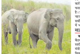
हाथियों ने गेरांव क्षेत्र में सोमवार तक के पहुंचे हैं।

कोरबा। वनमंडल कोरबा अंतर्गत कुसुम रेंज के वन परिसर चर्चिया से परसलने के गले पहुंचे हाथियों के दल ने कोरबा रेंज में उपगत चकला गुरु कर दिया है। चोरी गत हाथियों का दल जंगल से बाहर निकली और गेरांव गांव में ग्रामीणों की खेतों में पहुंचकर उत्पात मचाते हुए रवांदा लोच धान के थरहों को रौंदा दिया जिससे ग्रामीणों को काफी नुकसान उठाना पड़ा है। हाथियों द्वारा खेतों में पहुंचकर थरहा रौंदा करने की सूचना पर वन विभाग का अमला आज सुबह मौके पर पहुंचा और हाथियों द्वारा खेत में किये गए नुकसान का आंकलन करने के साथ ही रिपोर्ट तैयार की। फिले रेंजर को सूना जाएगा। रेंजर इसे प्रकरण अमला अजवाक खीकृत के लिए वन मंडलाधिकारी के समक्ष प्रस्तुत करेंगे। चूंकि हाथियों के दल ने अब उत्पात मचाया शुरू कर दिया है इसलिए वन विभाग ज्यादा सावक हो गया है। ग्रामीणों को मुनादी करारक लगातार साधनी बरतने पर जोर दिया जा रहा है। इस दल में 12 हाथी हैं जो गेरांव क्षेत्र में सोमवार तक के पहुंचे हैं।