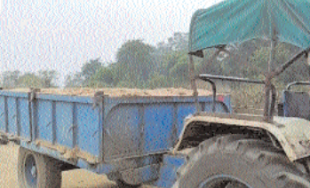
गौण खनिज से मिलने वाले लाखों करोड़ों के राजस्व की क्षति पहुंचा रहे हैं। हाल ही में स्वीकृत रेत घाट तदत के बाद कई कैमरे पर रेत चोरी को तस्करी जाकर हुई थी जिसके बाद जिला प्रशासन ने कहा रुख अमरणा था। कुलेस्वर ने अखंड रेत उखन परिवहन को रोकने कड़ी कार्रवाई के निर्देश दिए थे लेकिन प्रशासन के निर्देश के बावजूद रेत घाटों से शरा प्रेषित रेत चोरी को रोकना एक

कोरबा। जिले में स्वीकृत रेत घाटों से पूर्णतः अवरुद्ध रेत उखन को रोकने खनिज विभाग नकारा रहा है। स्वीकृत रेत घाटों को तीसरी आंख से निगरानी करने जिला प्रशासन द्वारा 3 साल पूर्व सीसीटीवी कैमरा लगाए जाने की व्यवस्था भी समय के साथ दम तोड़ गई। मौजूदा स्थिति में एक भी रेत घाटों में सीसीटीवी कैमरा नहीं लगाए जा सके। जिसकी वजह से स्वीकृत घाटों से रेत तस्करी रेत चोरी कर शासन को लाखों के राजस्व की क्षति पहुंचा रहे। यहां बताना होगा कि प्रदेश में रेत घाटों की उठना पड़ती समाप्त होने के बाद रेत घाटों के संचालन का अधिकार पंचायतों को दे दिया गया है। खनिज विभाग से प्राप्त दरखास्त अनुसार जिले में वर्तमान स्थिति में 7 रेत घाट स्वीकृत हैं। इनमें कोरबा तहसील अंतर्गत चूड़वा एवं कुदरमाल, कम्बोज तहसील अंतर्गत धरबपुर, बरपोती तहसील अंतर्गत तरदा, पनार तहसील अंतर्गत दुझपुर, मिरा एवं सोडी उपखण्ड तहसील अंतर्गत कुडरमाल में रेत घाट स्वीकृत हैं। कुडरमाल में जो छोटे-छोटे पानी के बड़े संपदा प्रदर्शन हैं कुडरमाल में अलग विभागिता संचालन करने हैं लेकिन इन गांवों में रेत घाटों में निगरानी व्यवस्था में दिवारों की वजह से रेत तस्करी अवरुद्ध रेत उखन परिवहन कर शासन को