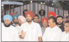
चंडीगढ़, 29 सितम्बर (एजेंसी)।