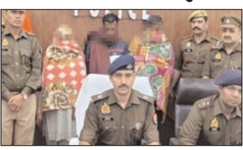
मुजफ्फरम, 29 नवंबर [एजेन्सी]

पुलिस ने नती ट्रेप का राजफास किया है। मामले में दंपती समेत तीन अभिषूक फंकेडे हैं। इनके कब्जे से मोबाइल फोन के अलावा फनी आउट कार्ड बचपद किए गए हैं। आरोपी महिला लोगों को प्रेम जाल में फंसाती थी, जबकि उसका पति दुकान के दादा आरोप लगाकर अरेब्ट रूपों की बखुरी करता था। दंपती समेत तीनों आरोपियों को न्यायालय में पेश कर जेल भेज दिया है। गृहकार को