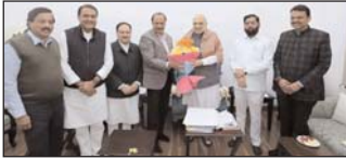
अध्यक्ष जेपी नड्डा से मुलाकात की। महाराष्ट्र विधानसभा चुनाव में भाजपा के नेतृत्व वाले महायुक्ति गठबंधन को बृहदम मिलने के बावजूद गृह मंत्रा मुख्मंत्रा कीन होंग इसपर फंसाला नई हुंग। 280 सदस्यीय महाराष्ट्र विधानसभा में 132 सीटों के साथ भाजपा सबसे बड़ी पार्टी बनकर उठेगी, जबकि उसके सहयोगी- एकनाथ शिंदे के नेतृत्व वाली शिवसेना ने 57 और अजित पवार के नेतृत्व वाली एससीपी ने 41 सीटें हासिल

नईदिल्ली, 29 नवंबर [एजेन्सी] महाराष्ट्र सरकार के गठन को लेकर केंद्रीय गृह मंत्री अमित शाह के आवास पर बैठक शुरू हो गई है। बैठक में वरिष्ठ भाजपा नेताओं के साथ महाराष्ट्र के विधायकों के लिए महाराष्ट्र के नेता देवेंद्र फडणवीस, एकनाथ शिंदे और अजित पवार नई दिल्ली पहुंच चुके हैं। अमित शाह के आवास पर भाजपा का केंद्रीय नेतृत्व इन बैठकों के दौरान अपने मुख्यमंत्री पर फंसाले को अंतिम रूप देगा। महाराष्ट्र के कर्मचारीक सीएम और पार्टी मुख् एकनाथ शिंदे के दिग्दर्शक होने पर शिंदे के गठबंधन में उनका स्वागत किया। शिंदे, भाजपा नेता देवेंद्र फडणवीस और एससीपी मुख् अजित पवार गृह मंत्री अमित शाह के आवास पर पहुंच गए हैं।